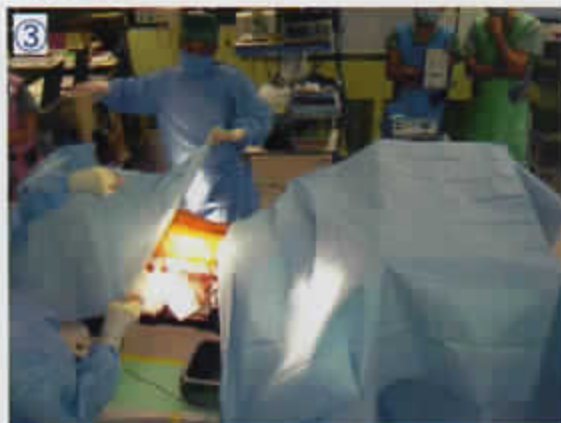
③ テープ無しドレープで頭側を覆う