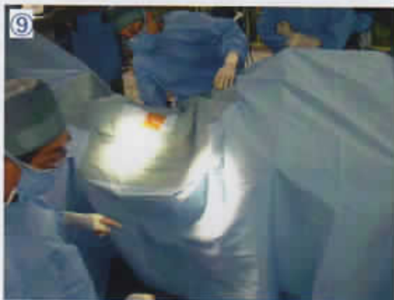
9 全面ドレープのすそを右側から左側へ送る