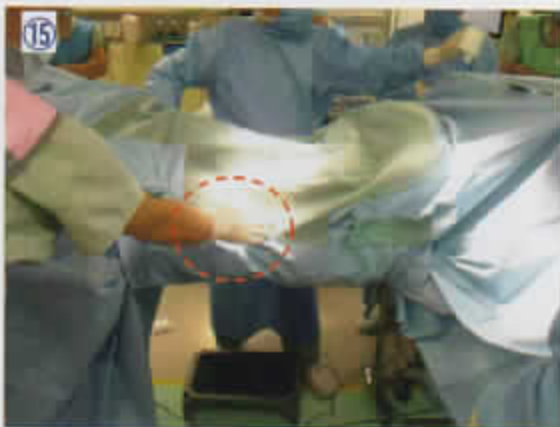
15 オيفテープで3箇所程度とめる