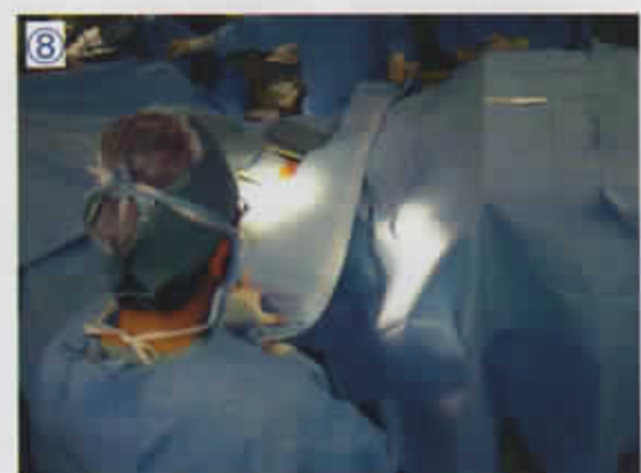
⑧ 全面ドレープで全体を覆う