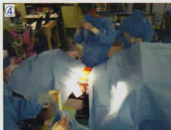
④ テープ付き小ドレープのテープを剥がす