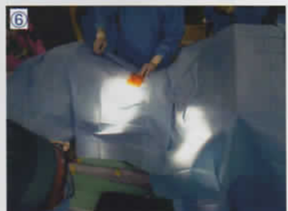
⑥ テープ付き小ドレープを右側へ貼る