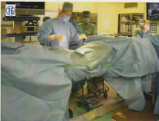
16 360度清潔野を確保するドレーピング完了