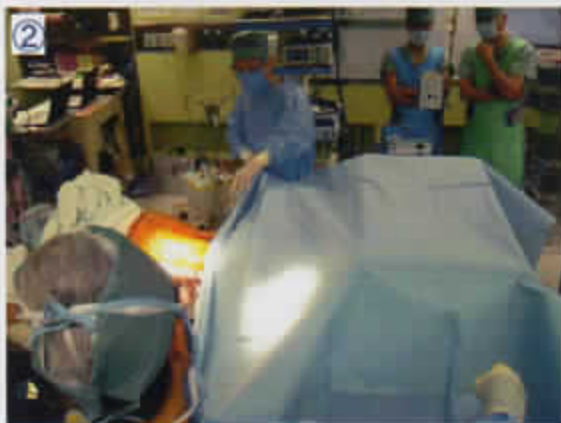
② オーバーテーブルカバーでオーバーテーブルと尾側を覆う