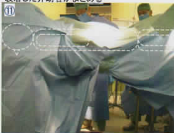
11 まとめたすそをオيفテープで留める