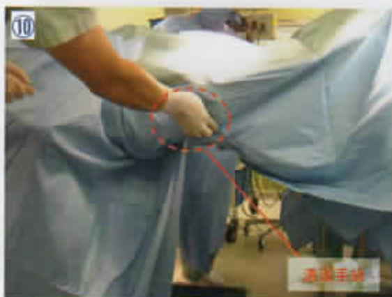
10 右側から送られた全面ドレープのすそを清潔手袋装着した介助者がまとめる