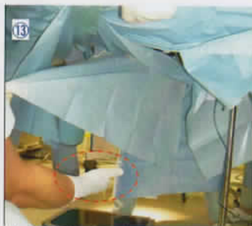
13 右側から送られたすそを介助者が受け取る