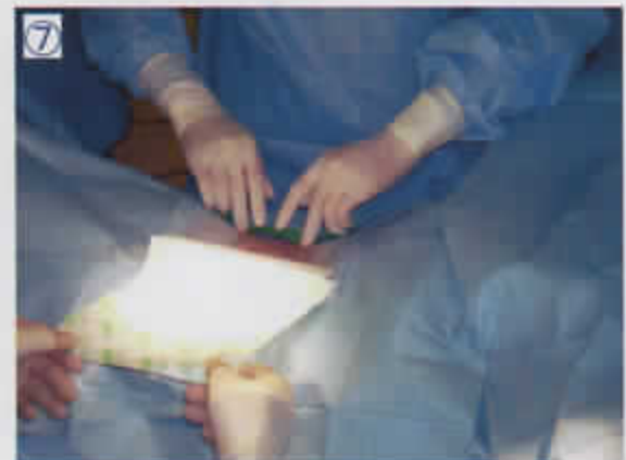
⑦ プラスチックドレープを貼る