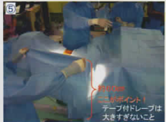
⑤ テープ付き小ドレープを左側へ貼る