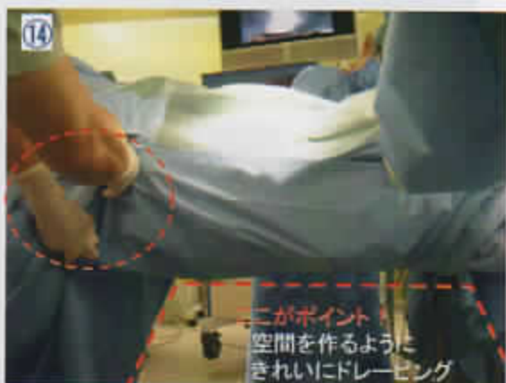
14 下面をきれいに覆うようにドレーピングする