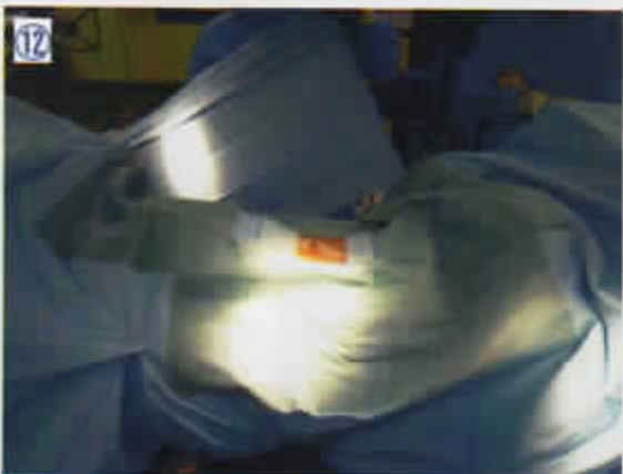
12 さらにテープ付ドレープを右側面に張りそのすそを左側へ送る